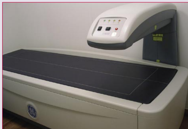
General Electric, das „große“ Lunar prodigy DXA

Wir verfügen über ein hochmodernes Gerät von General Electric, das „große“ Lunar prodigy DXA. Dieses Gerät kann bei Bedarf (z.B. wenn man künstliche Gelenke hat) auch Ganz-Körper-Aufnahmen durchführen. Mit ihm kann auch eine Analyse der genauen Körperzusammensetzung (Knochen, Muskeln, Fettgewebe) durchgeführt werden.